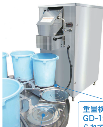
重量検出装置GD-1が取り付けられています。