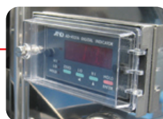
デジタルインジケータ