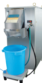
大容量ポリバケツやドラム缶の時